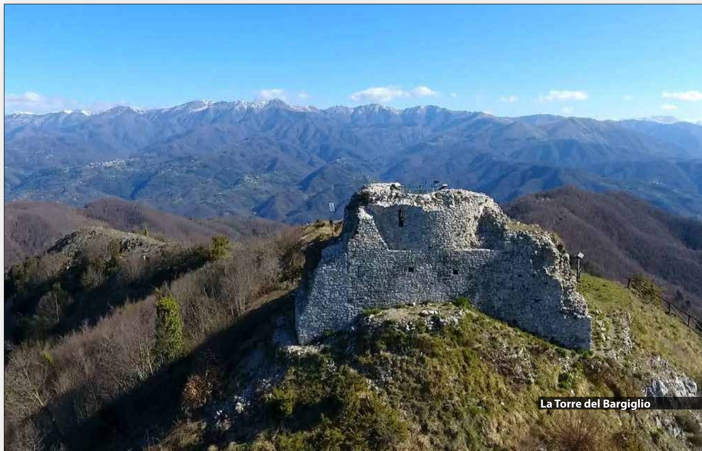
La Torre del Bargiglio

PARTENZA CON AUTO PROPRIE ORE 8.00 DA PRATO , PIAZZALE DEL TRIBUNALE