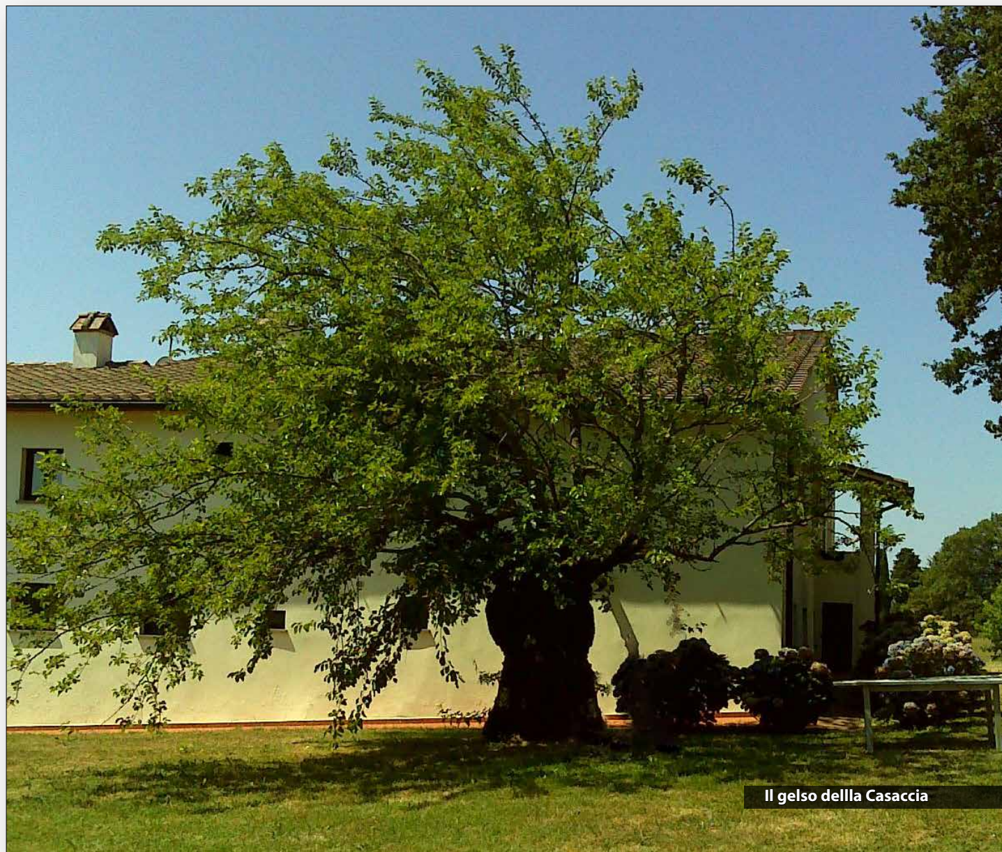
Il gelso della Casaccia

RITROVO ALLE ORE 7.30 A MONTEMURLO, PIAZZA DON MILANI