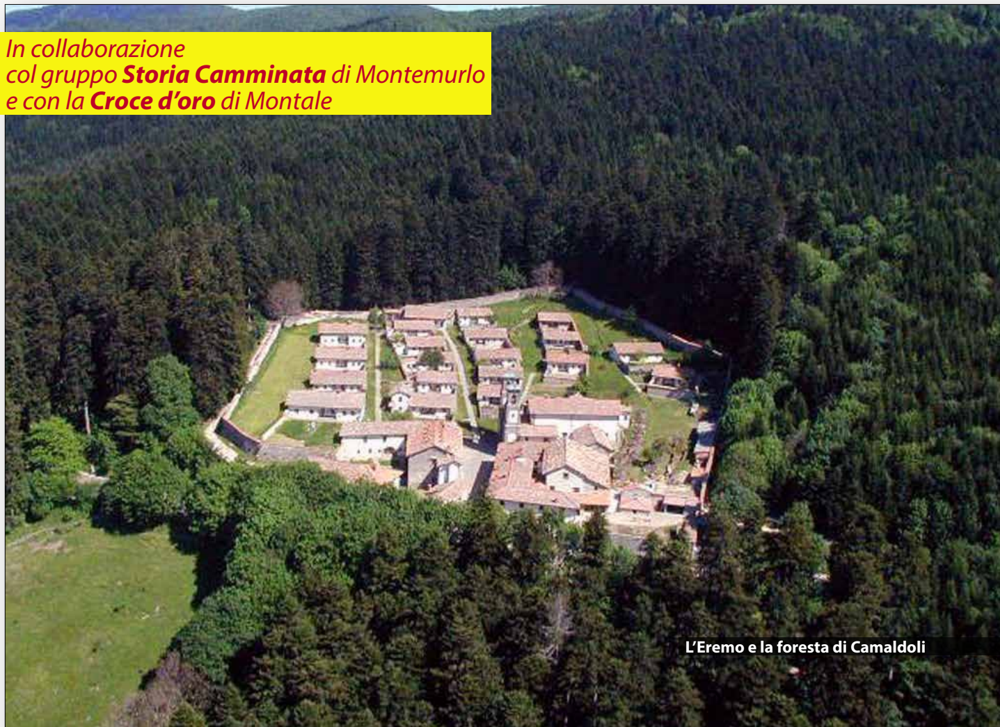
L'Eremo e la foresta di Camaldoli

In collaborazione col gruppo Storia Camminata di Montemurlo e con la Croce d'oro di Montale