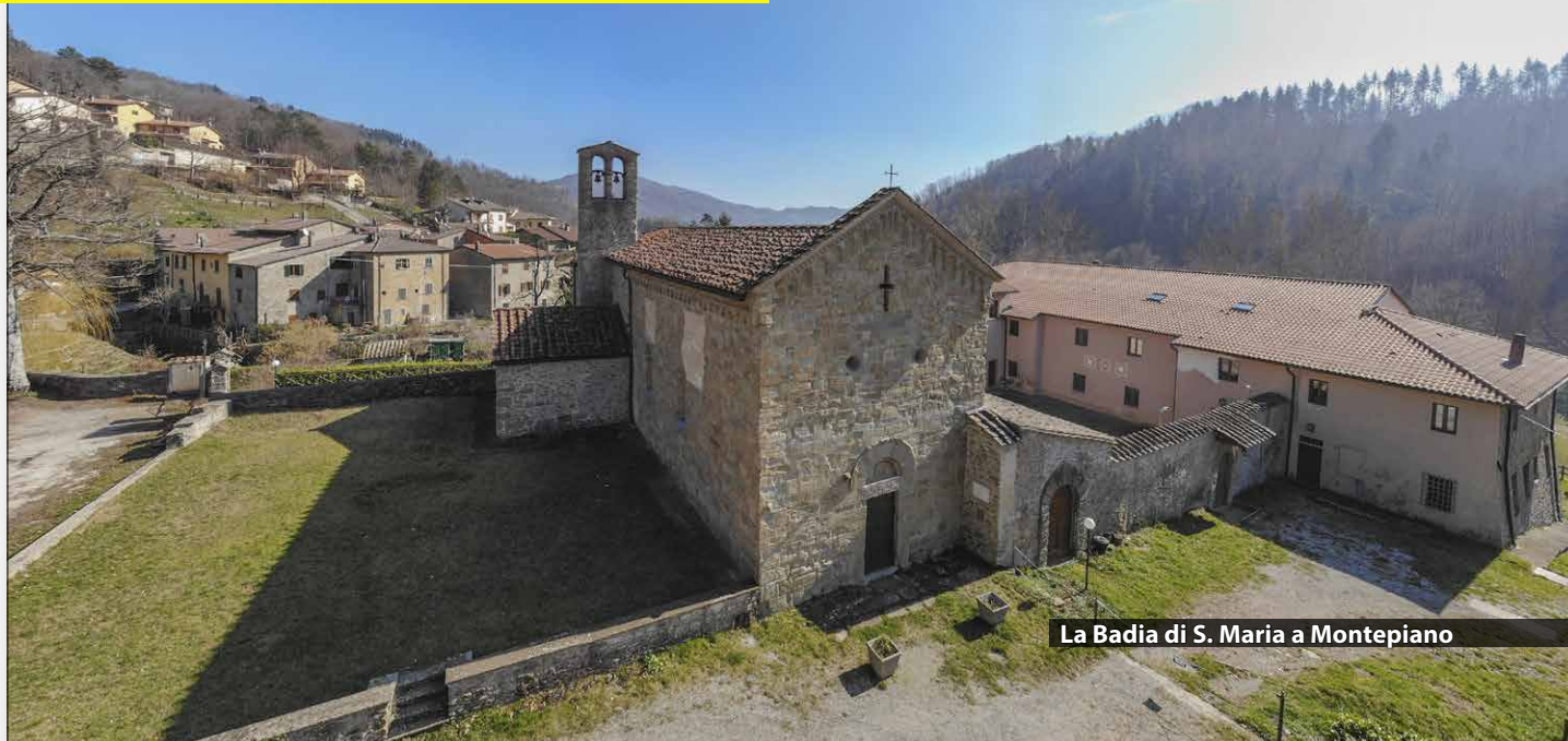
La Badia di S. Maria a Montepiano

In collaborazione col gruppo Storia Camminata di Montemurlo e con la Croce d'oro di Montale