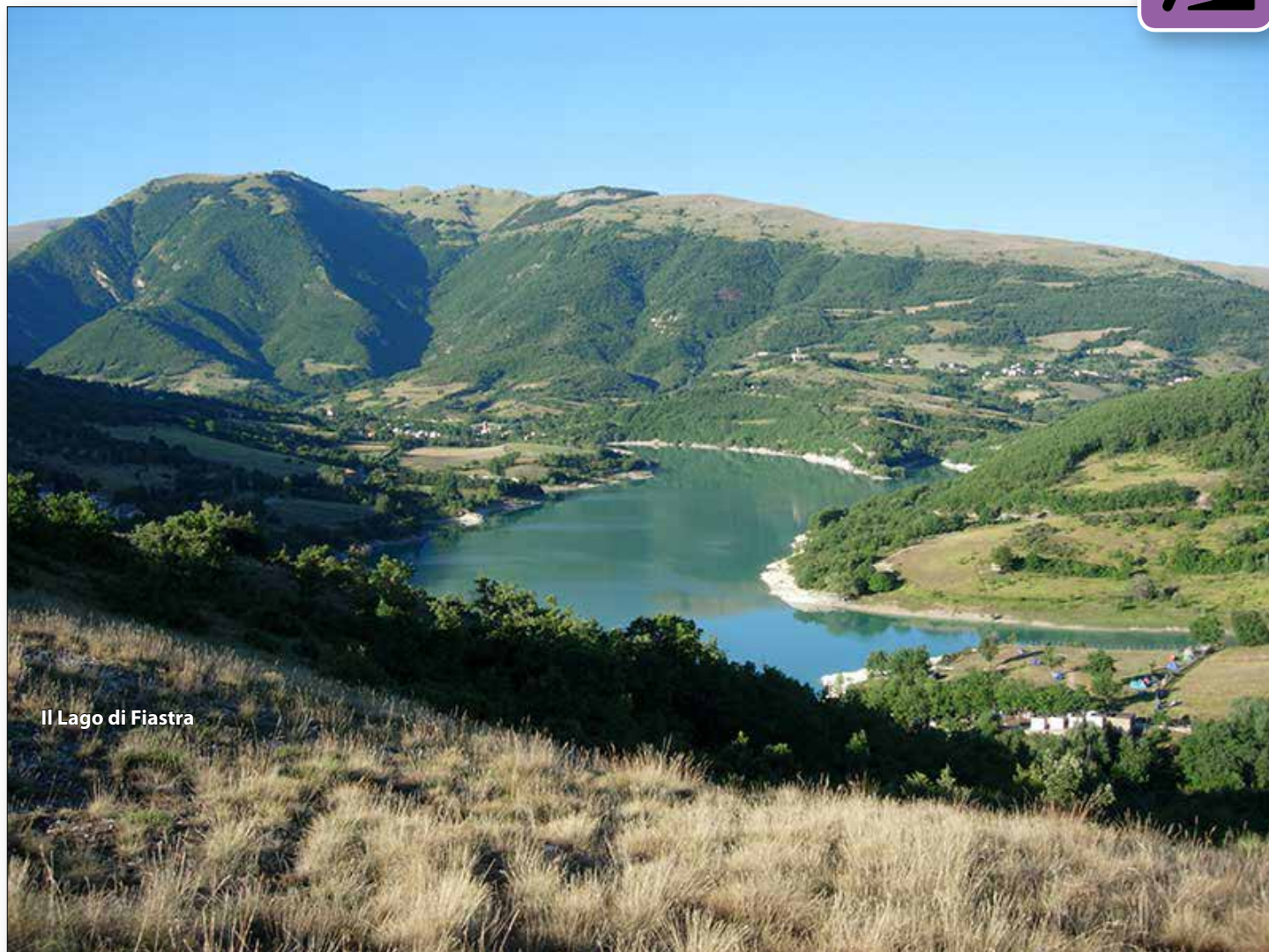
Il Lago di Fiastra

PARTENZA con auto proprie: ORE 6.30 da PRATO , Piazzale del Tribunale