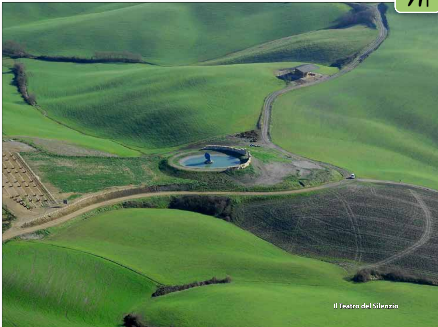
Il Teatro del Silenzio

PARTENZA CON AUTO PROPRIE: ORE 7.30 DA PRATO, PIAZZALE DEL TRIBUNALE